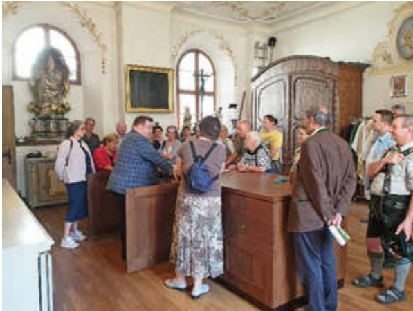
Sakristei Pfarrkirche Maria Himmelfahrt

Besonders beeindruckte uns die große Sakristei. In besonderen Schränken sind Kelche, Schalen und Gewänder untergebracht.