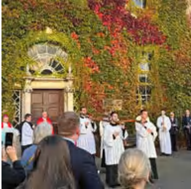
Bistumsdelegation aus Würzburg

An den Wochenenden versuche ich mit ein paar Freunden in Tagestrips das Land zu erkunden. Bekanntermaßen ist Irland nicht allzu groß und die Westküste ist in 3 Std. erreichbar.