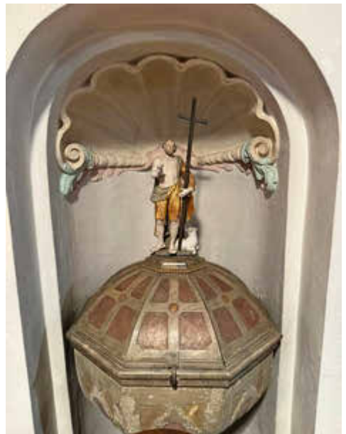
St. Laurentius Eberfing