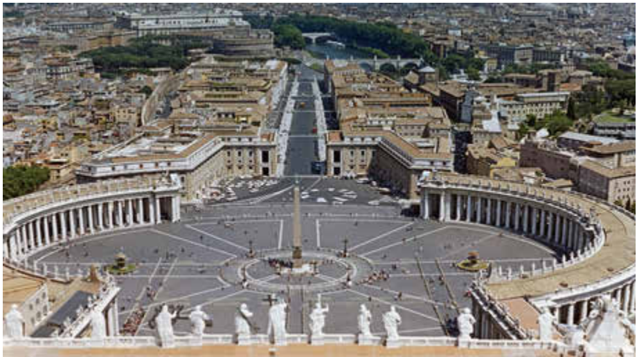
Petersplatz, im Hintergrund die Engelsburg und Engelsbrücke über den Tiberfluss