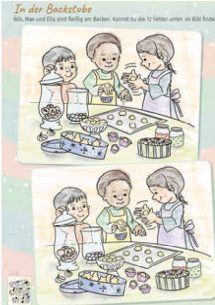
Rätsel: In Gemeindedruckerei