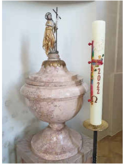
St. Michael Etting