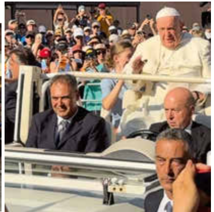
Papst Franziskus im Papamobil