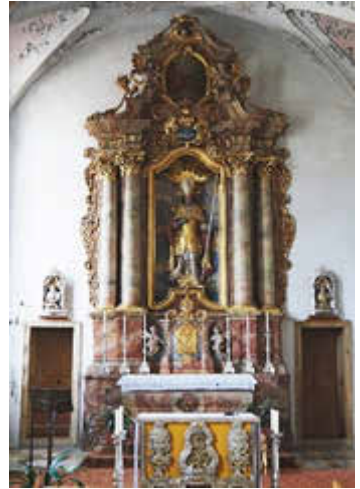
Klosterkirche St. Martin

Seitlich nach Norden liegt die ehemalige Pfarrkirche und heutige Klosterkirche St. Martin. Sie wird von den Ordensschwestern und für kleinere Familiengottesdienste und Andachten genutzt ( Info teilweise aus Wikipedia, Alpen-Guide.de ).