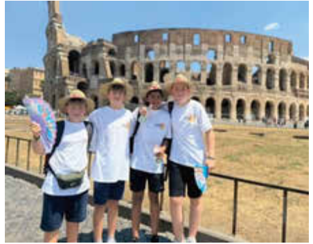
Vor dem Kolosseum