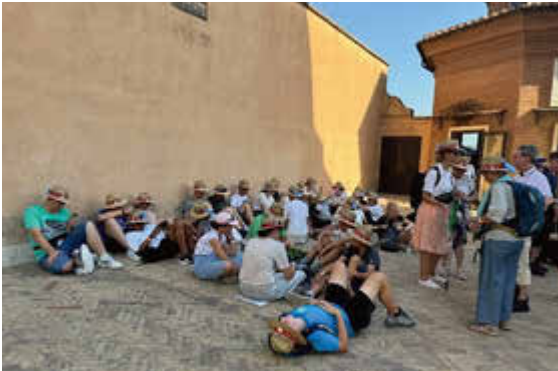
Bei der Hitze war Schatten gefragt