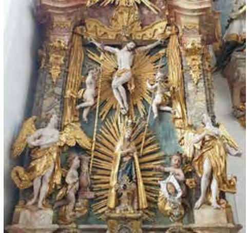
Marienaltar (links) und Leidensaltar (oben)