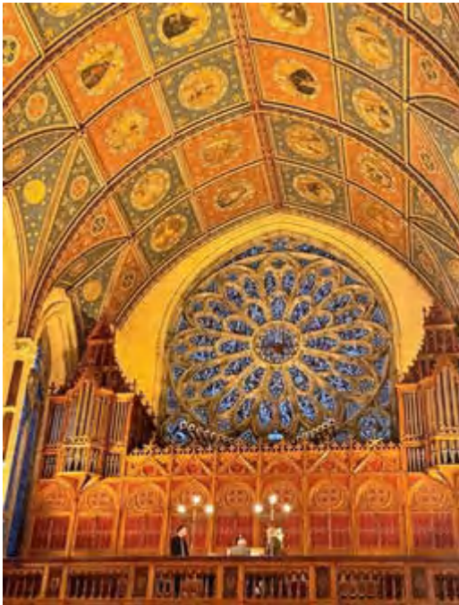
St. Patrick's College-Kapelle