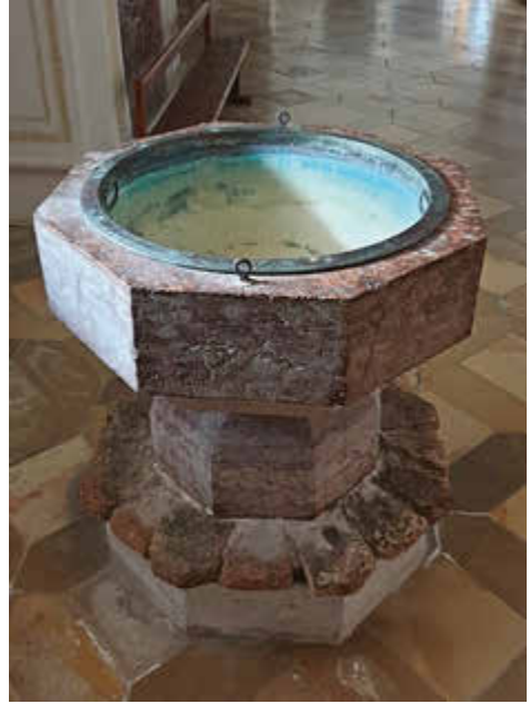
Hl. Kreuz Polling